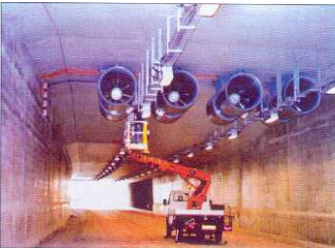
Aufhängekonstruktion eines Strahlflüfers. Es ist Aufgabe der Planer, genau zu bestimmen, welche Bauteile einer Aufhängekonstruktion aus welchen Materialien zu fertigen sind.

In skandinavischen Ländern wie Norwegen werden Tunnelbelüftungen nur «sehr grob» ausgeschrieben. Das heisst: Ein Planer in Norwegen legt die Anlage als solche zwar aus, jedoch gibt er dann nur Druck, Volumenstrom oder aber den Schub und die Beschaffenheit der Ventilatoren vor. Die korrekte Wahl der Anzahl und Grösse der Ventilatoren bleibt den Anbietern überlassen. Alle Anbieter können dann anhand der Vorgabe und Zeichnungen verschiedene Varianten ausarbeiten. Das ausschreibende Büro überprüft dann nach Abgabeschluss die angebotenen Varianten auf ihre Funktionalität und die Betriebskosten für den eigentlichen Endbetreiber. Dabei werden dann sehr häufig Varianten ausgewählt und auch beauftragt, welche im ersten Moment zwar teuer aussehen, sich jedoch bereits nach wenigen Jahren aufgrund der niedrigeren Verbrauchskosten amortisieren.